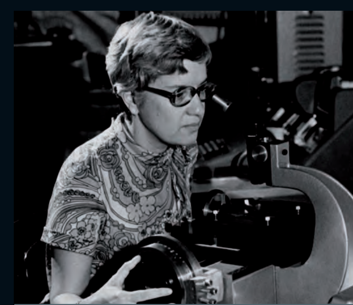
V. Rubin (Carnegie Instit. Washington)

L'equip de Vera Rubin reuneix proves convincentes de l'existència de matèria fosca en les galàxies estudiant-ne els moviments de rotació.