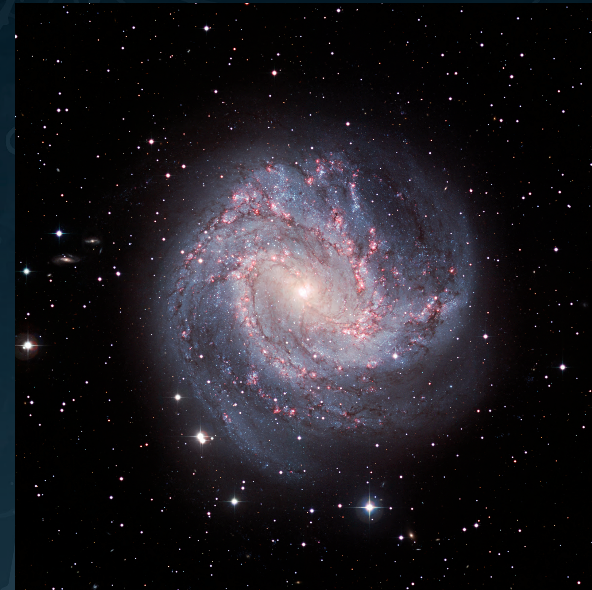
Galàxia M83 (ESO)

A la imatge, un cúmul de galàxies distorsiona la llum provinent de galàxies i quàsars encara més llunyans. En canvia les formes i mides, i arriba a crear múltiples imatges del mateix objecte.