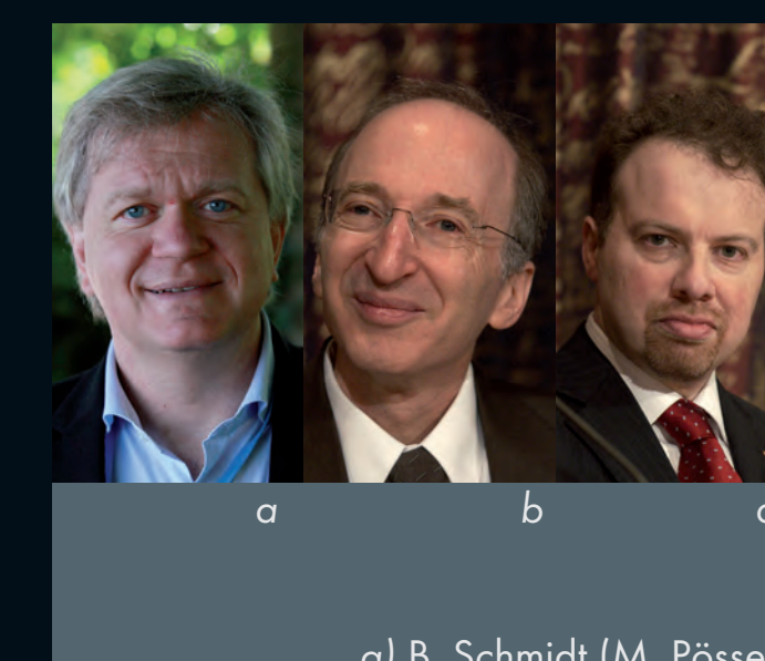
a) B. Schmidt b) S. Perlmutter c) A. Riess

El Supernova Cosmology Project i el High-z Supernova Search Team, dirigits per Saul Perlmutter, Brian Schmidt i Adam Riess mesuren l'expansió accelerada de l'univers (Premi Nobel 2011).