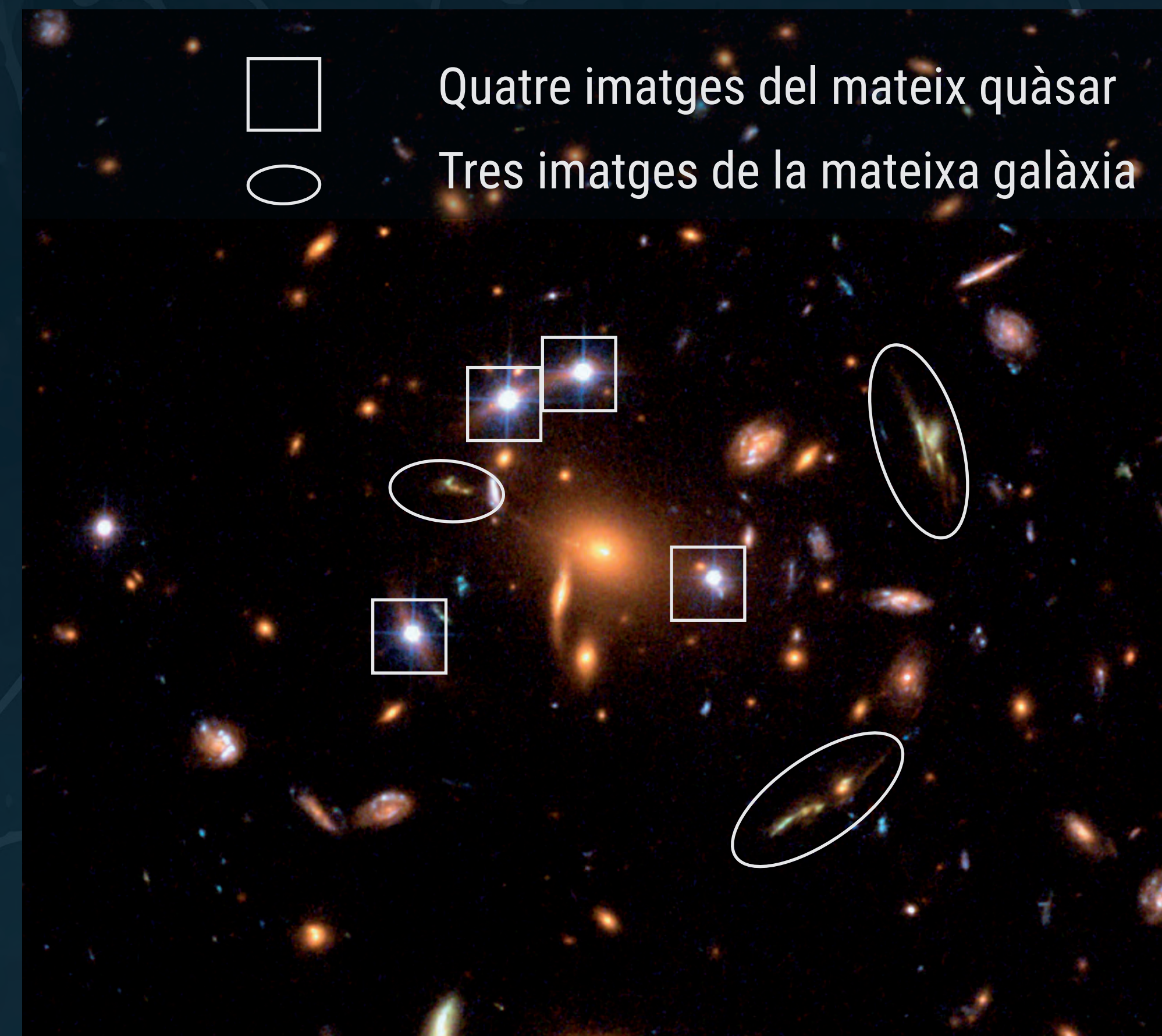
Múltiples imatges de quàsars i galàxies degudes al cúmul de galàxies SDSS J1004+4112

Mentre la matèria fosca atreu la matèria visible i fomenta la formació de galàxies, l'energia fosca té l'efecte contrari atesa la seva naturalesa repulsiva. La matèria fosca també afecta la distribució de les galàxies i els seus moviments dins els cúmuls de galàxies.