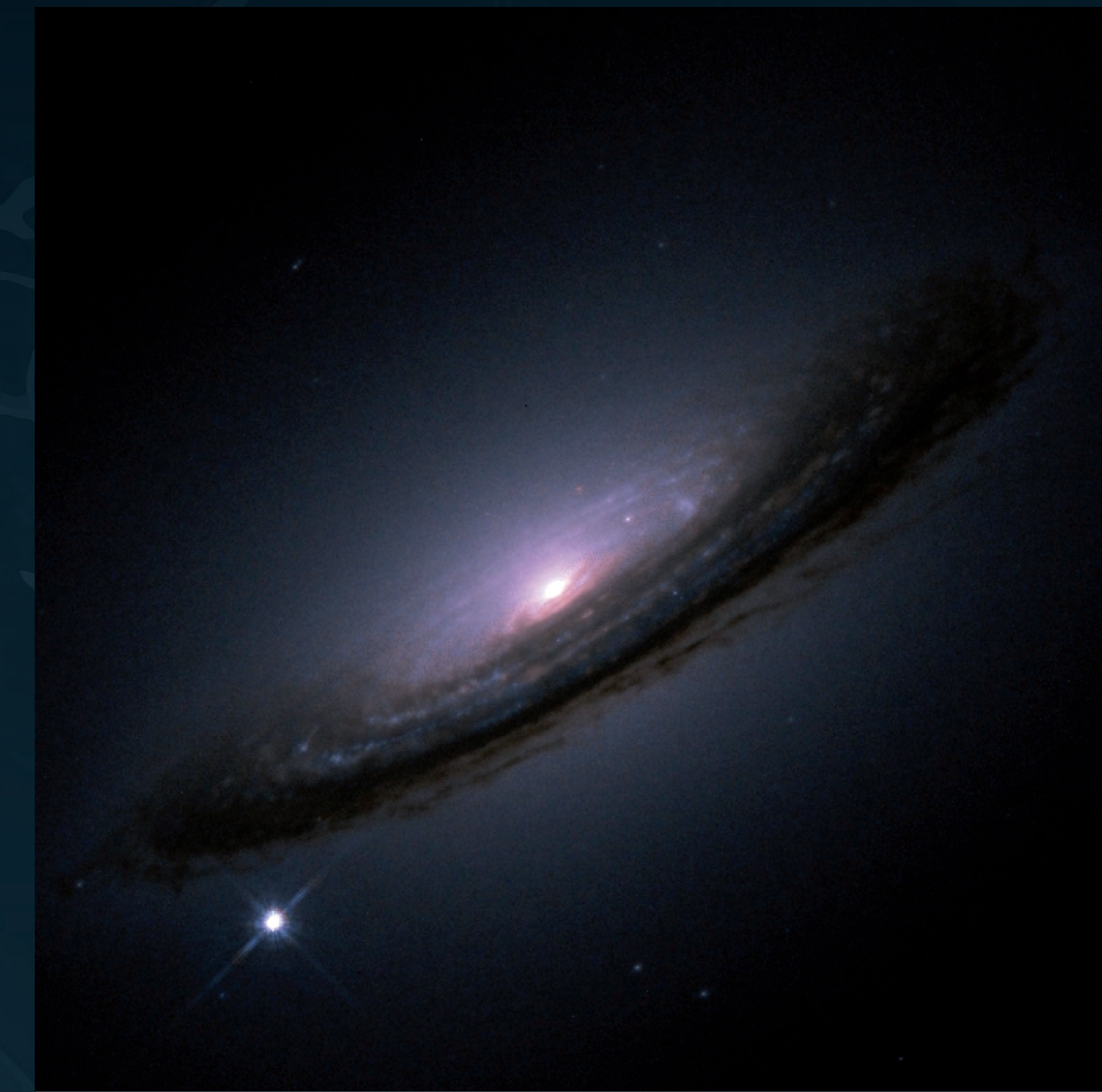
Supernova 1994D a la galàxia NGC 4526

Es creu que la matèria fosca està distribuïda en núvols gegants, entorn de les galàxies, anomenats halos , unes deu vegades més grans i més massius que la galàxia observada.