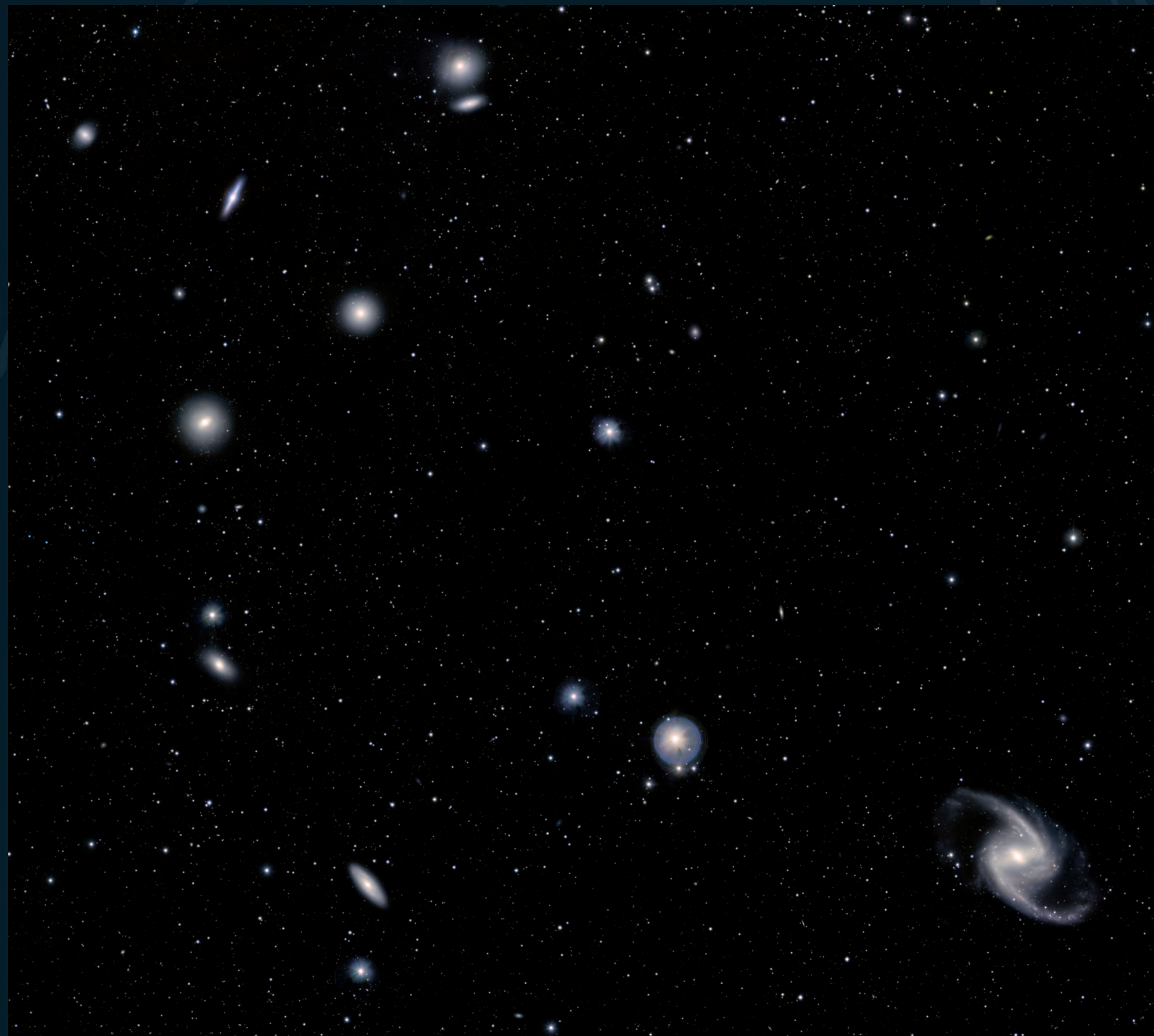
Cúmulo de Fornax