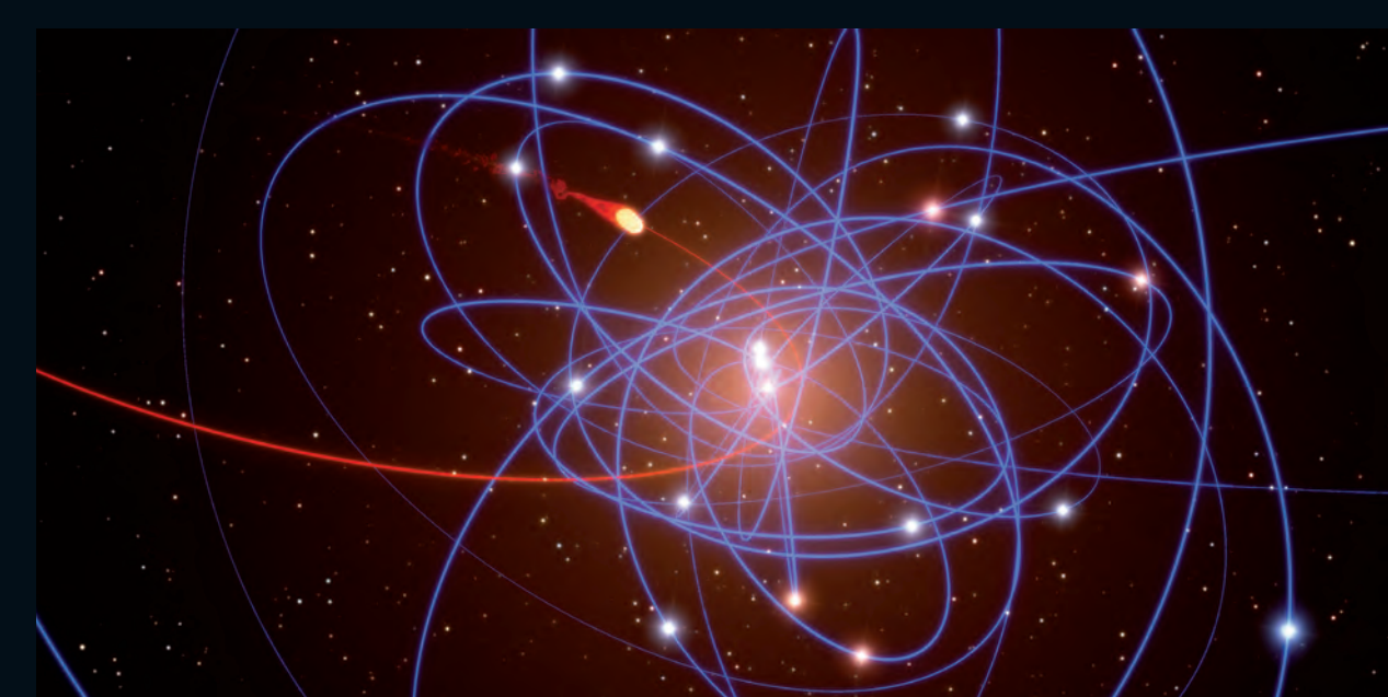
Simulació d'un nivell de gas apropant-se al forat negre supermassiu del centre de la Via Làctia (ESO)

S'obtenen proves sòlides de l'existència de Sagitari A*, un forat negre supermassiu al centre de la nostra galàxia.