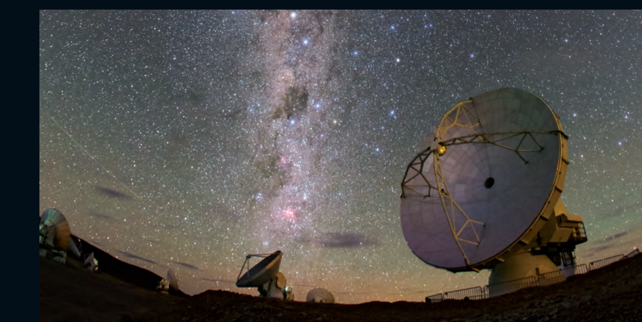
Via Làctia sobre les antenes d'ALMA

Començarà a operar plenament el «telescopi de l'horitzó d'esdeveniments», capaç d'observar l'ombra de Sagitari A*.