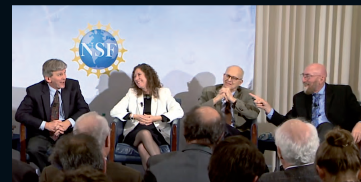
Anunci de la detecció (National Science Foundation)

La col·laboració LIGO (Laser Interferometer Gravitational-wave Observatory) aporta la prova més directa de l'existència de forats negres en forma d'ones gravitacionals.