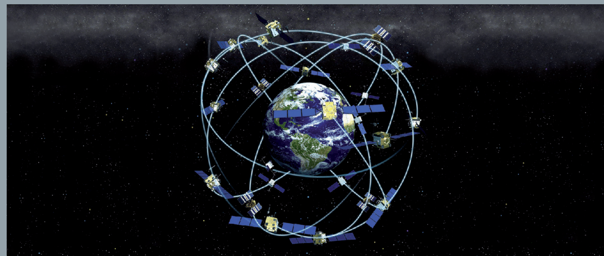
Orbites dels satèl·lits GPS (NOAA)

Segons la relativitat general, la llum es desvia quan es propaga en un espai-temps deformat per la presència de cossos molt massius, com ara estrelles, planetes o galàxies. Aquest fenomen provoca distorsions òptiques estranyes.